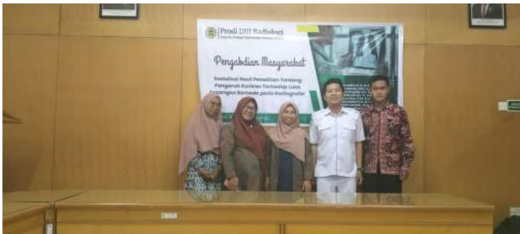
Gambar 3. Dokumentasi Dengan Kepala Instalasi Radiologi