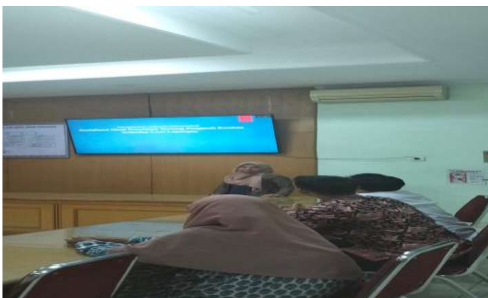
Gambar 4. Dokumentasi presentasi