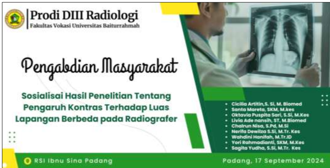
Gambar 2. Judul Pengabdian