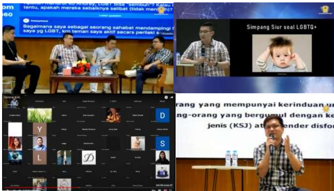
Gambar 1. kegiatan webinar pada tanggal 17 Agustus

Pendidikan karakter dalam keluarganya. Penyampaian materi dilakukan sesuai dengan kemampuan dan masing-masing kelompok usia anak.