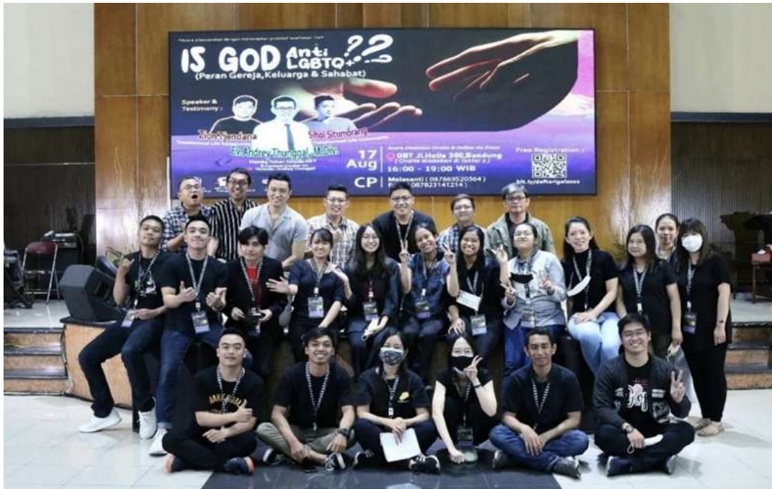
Gambar 2. Dokumentasi pelaksanaan kegiatan