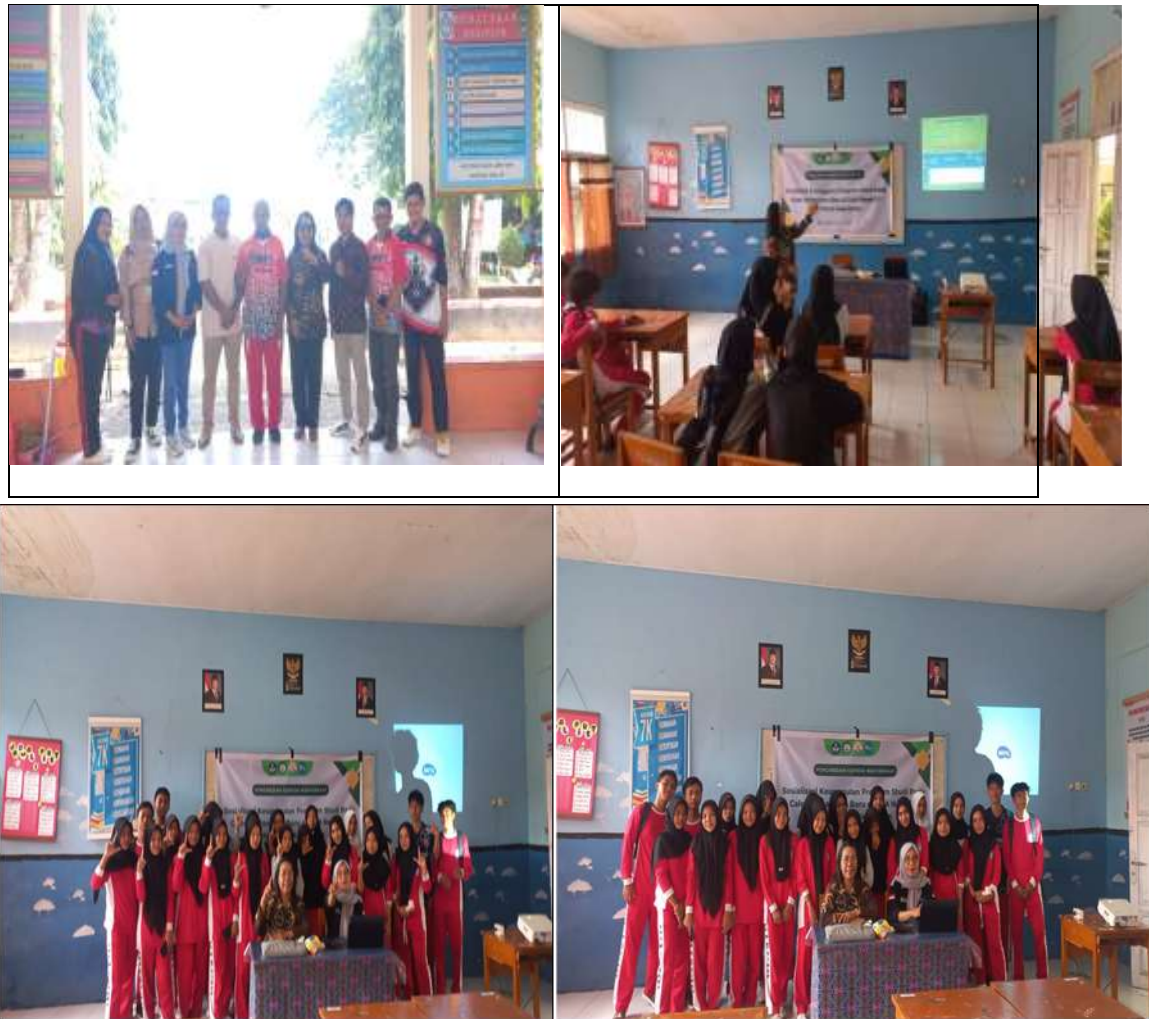
Gambar. 2 Hasil dokumentasi kegiatan